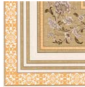
Absolut Gres Taco PEI-IV 24,5 x 24,5 cm C-780