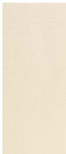
Absolut Ivory 31,6 x 75,6 cm C-574