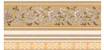
Absolut Gres Cenefa PEI-IV 24,5 x 49,1 cm C-780