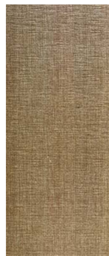
Memory Oro 31,6 x 75,6 cm C-357