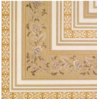
Absolut Gres Rossone PEI-IV 49,1 x 49,1 cm C-780