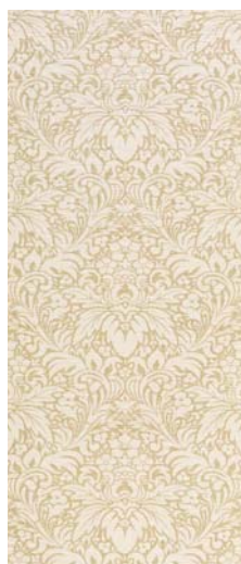
Absolut Gold Ornato 31,6 x 75,6 cm C-590