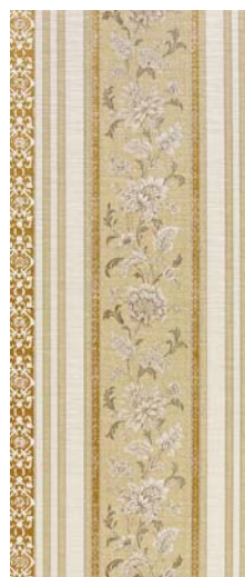
Absolut Gold Decor 31,6 x 75,6 cm C-350