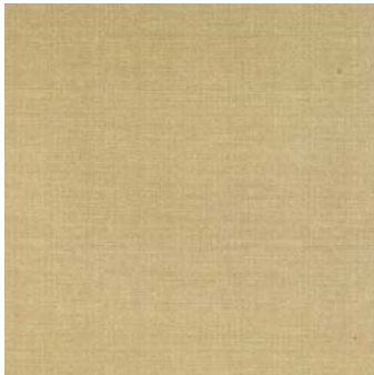
Absolut Gold Gres PEI-III 49,1 x 49,1 cm C-910