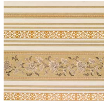
Absolut Gres Greca PEI-IV 49,1 x 49,1 cm C-780