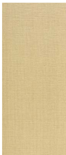
Absolut Gold 31,6 x 75,6 cm C-580